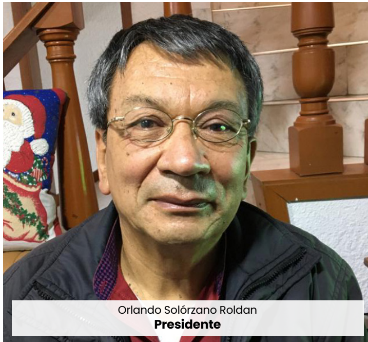
Orlando Solórzano Roldán Presidente

El Estado Colombiano, a nivel económico, continúa prolongando la herencia colonial, de ser altamente alcabalero. Predomina la política de tributar, por todas las actividades que se realicen; gravar con impuestos inclusive a la misma canasta familiar, en lo que se considera como impuestos regresivos.